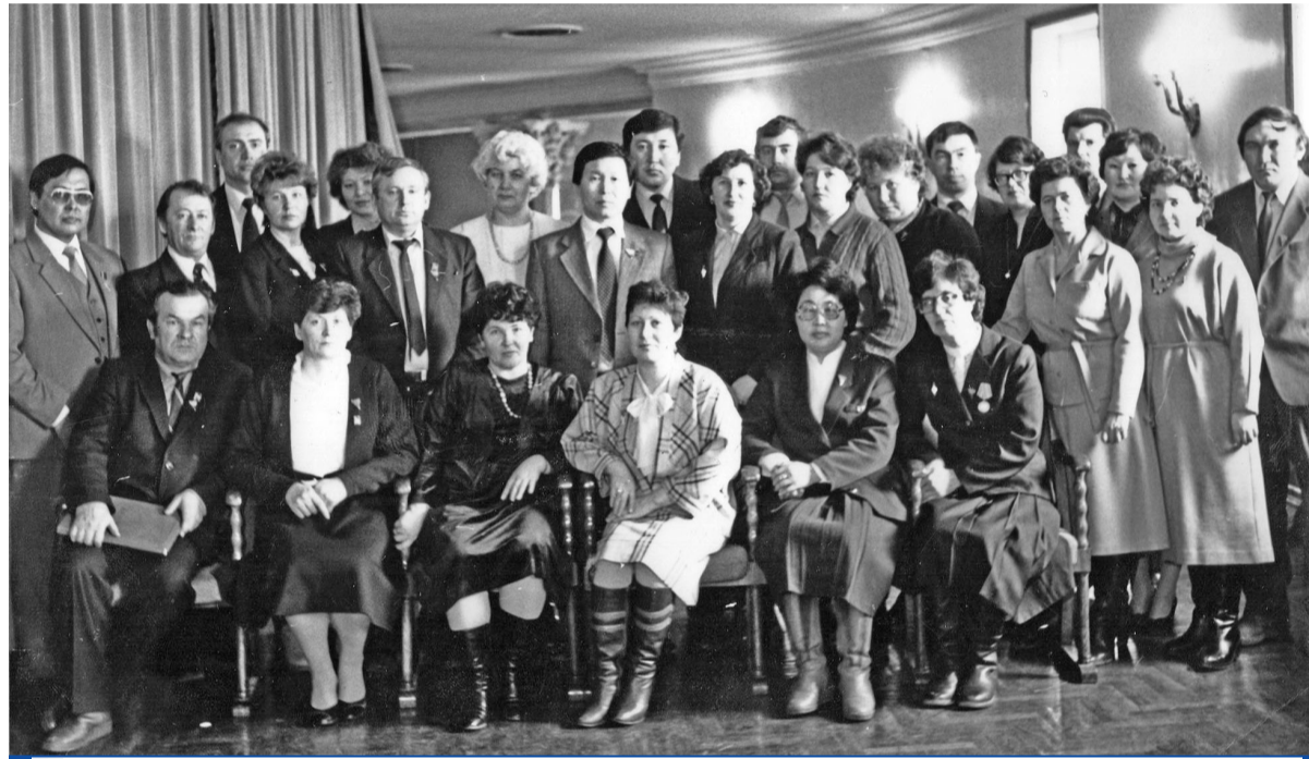
Март 1987г. г.Улан-Удэ. Слёт учителей Бурятии

ча Некрылова, - малая площадь учебных мастерских. Недостает материалов, инструментов, оборудования, отсутствуют резцы, фрезы, сверла. Плохо снабжается школа современными ручными электроинструментами. Есть трудности в приобретении черных и цветных металлов, пластмассы, тканей».